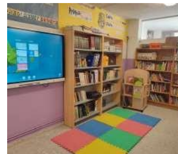
Zona de expositor y alfombra