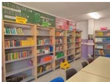
Estanterías con libros para los más pequeños